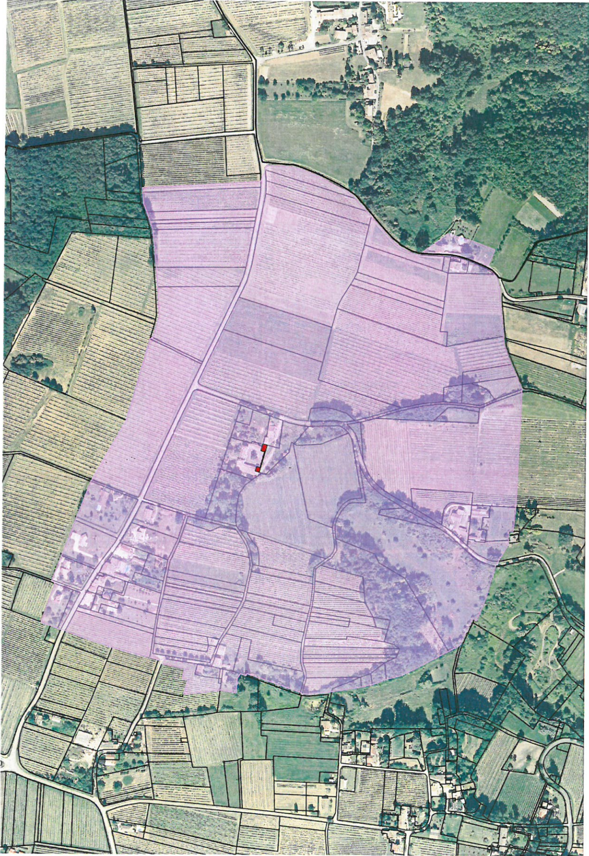
Annexe 1/1 Plan du Périmètre Délimité des Abords du château de la Raye sur la commune de Vélaines